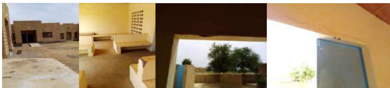
Vue CSI enduit (banc attente) fissures arrêtes problèmes crochets