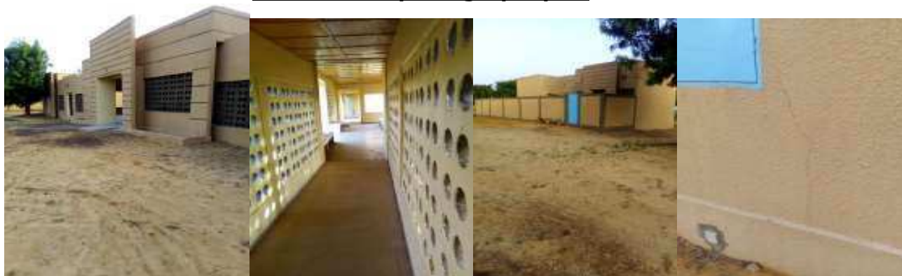
Vue façade CSI Couloir circulation logement majeur Apparitions des fissures

✚ Marché n° : 015/2017/GC/MSP/SG/FC-PDS : Travaux de transformation des 10 cases de santé en centre de santé intégré de type 1 (CSI.1), 3 ème phase : centré intégré CSI koaya (DS Magaria)