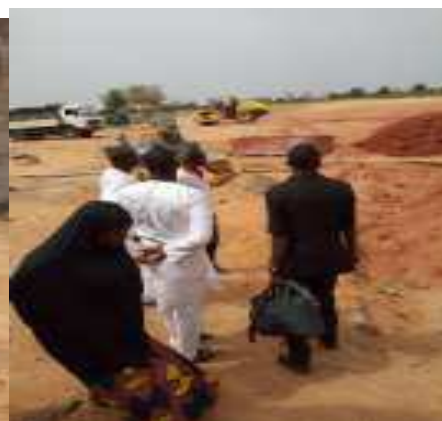
les matériels des travaux