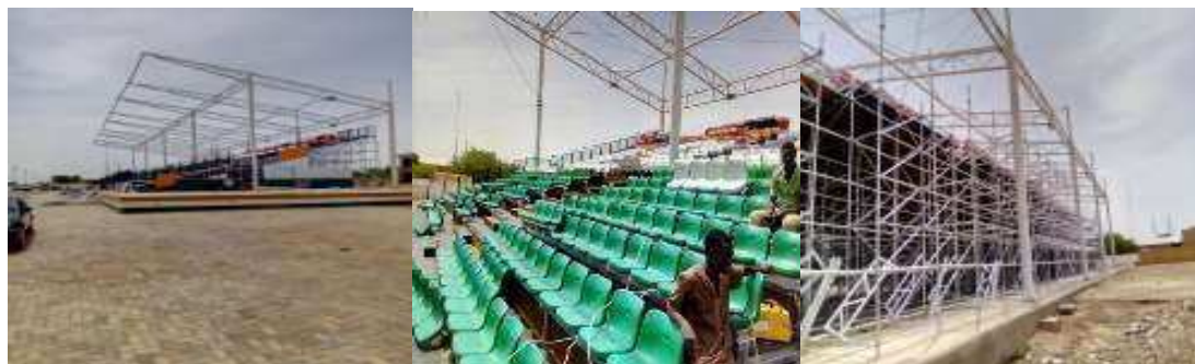
Vue la toiture de la tribune poses des chaises problèmes (enduit et nettoyage)