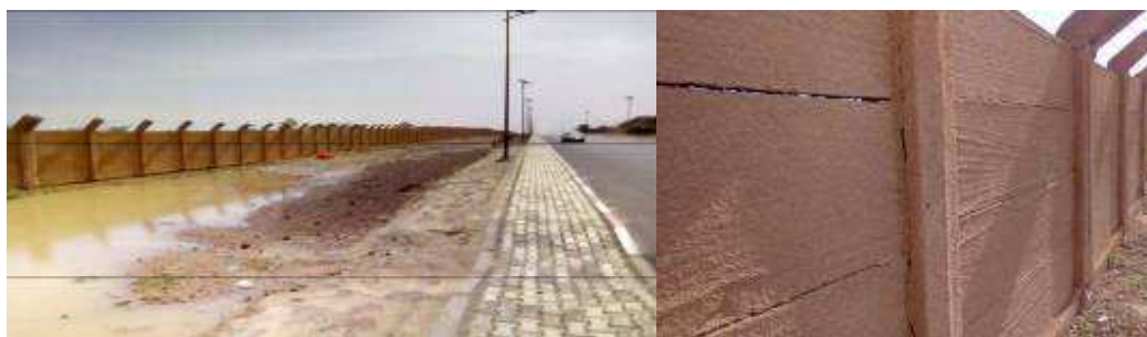
(Stagnation des eaux de pluies)