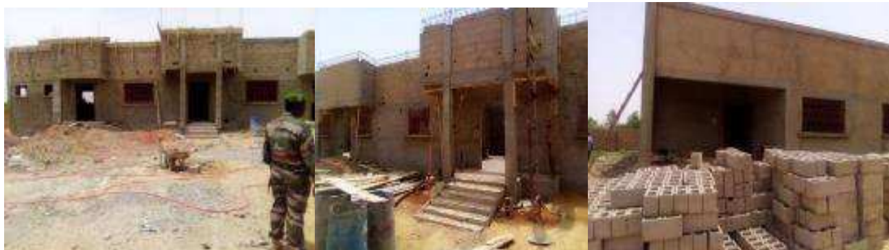
Cage de passage