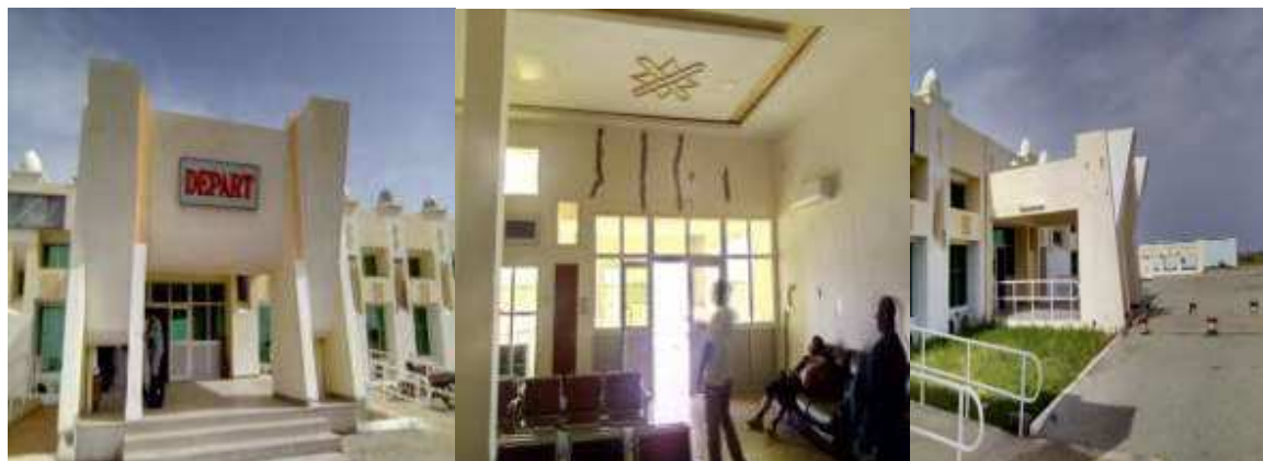
Vue aéroport de Zinder Apparitions des fissures sur enduit intérieur et extérieur