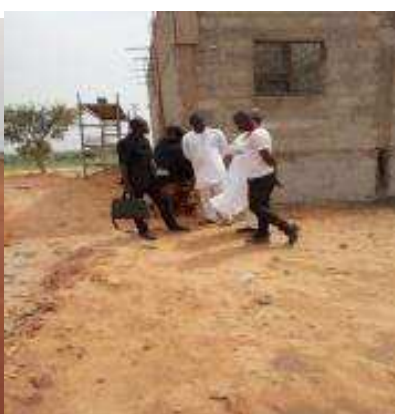
bâtiment en cours