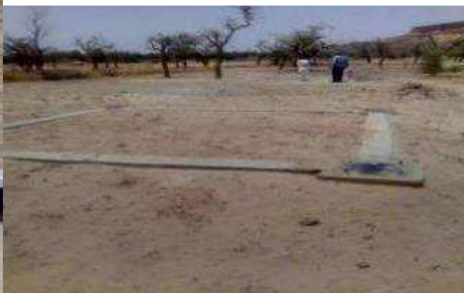
socle du château