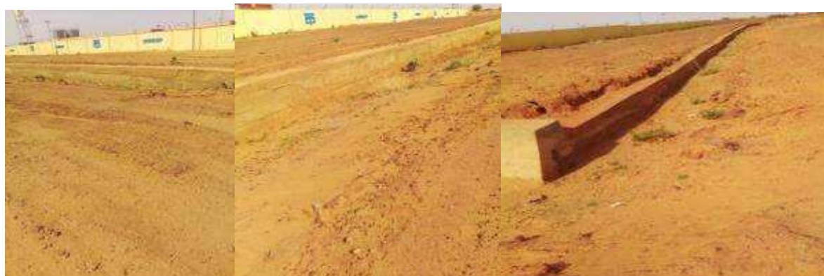
Travaux d'aménagement de la devanture de dépôt pétrolier de la SONIDEP