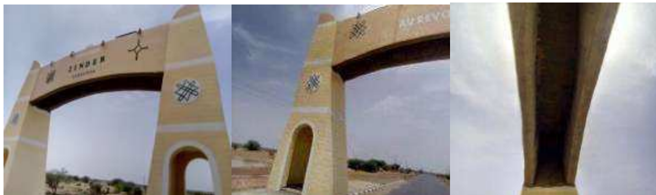
Vue Portique (écritures mal faites) enduit et extérieur mal raccordés