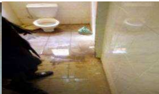
problème de plomberie