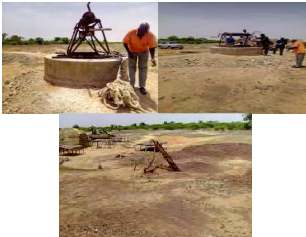
Puits aire de chanono-mazoubi (Cr de Dankassari)