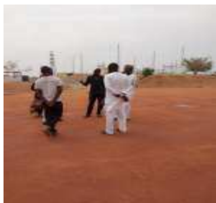
Travaux de terrassement