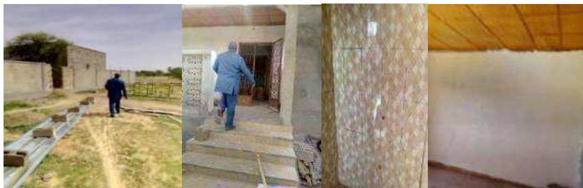
Vue des travaux en cours pose des carreaux et faïences badigeonnage à la chaux