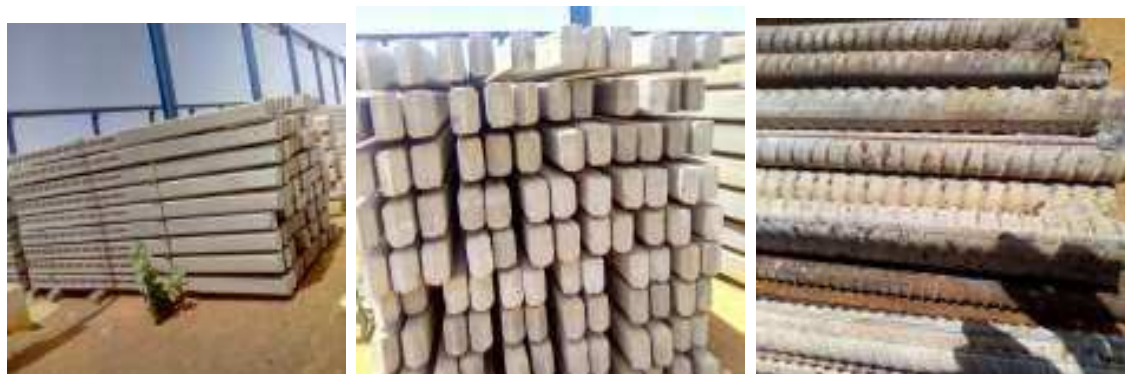
Vue sur les poteaux fabriqués les aciers utilisées