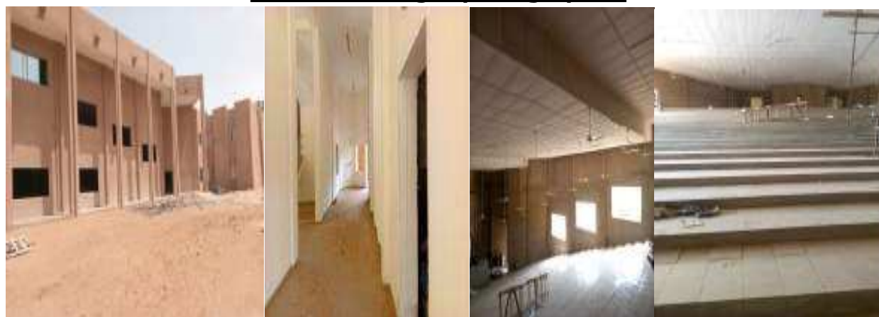
Amphithéâtre 1000 places à la faculté des sciences de l'université Abdou Moumouni