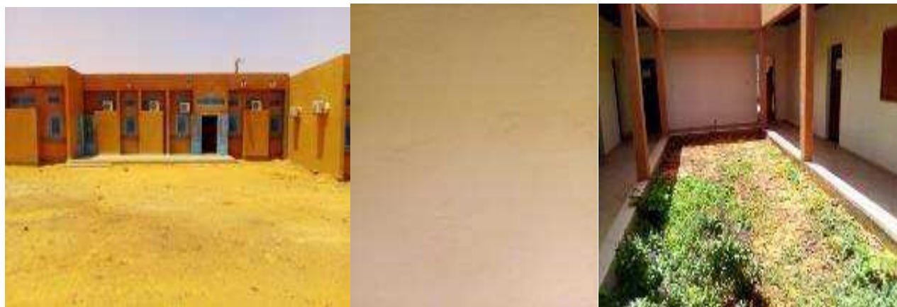
Enduit ciment intérieur