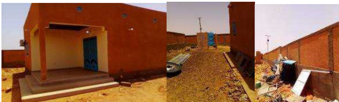
Case de passage