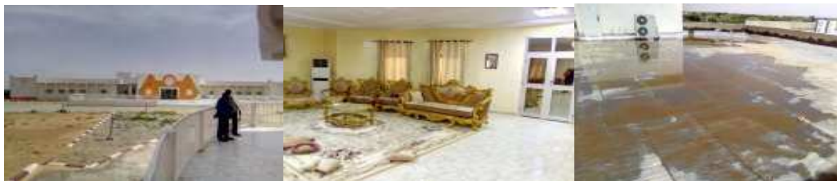
Vue de la case présidentielle vue intérieur stagnations des eaux