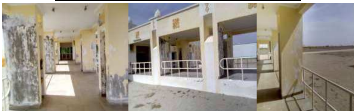
Détérioration de peinture intérieure et extérieure