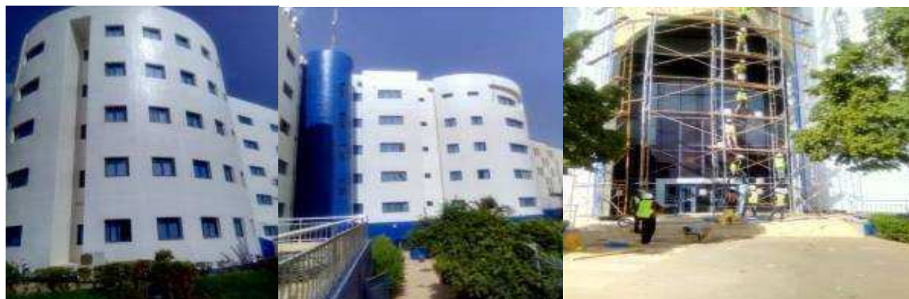
Reprise de revêtement extérieur SONIDEP siège à Niamey