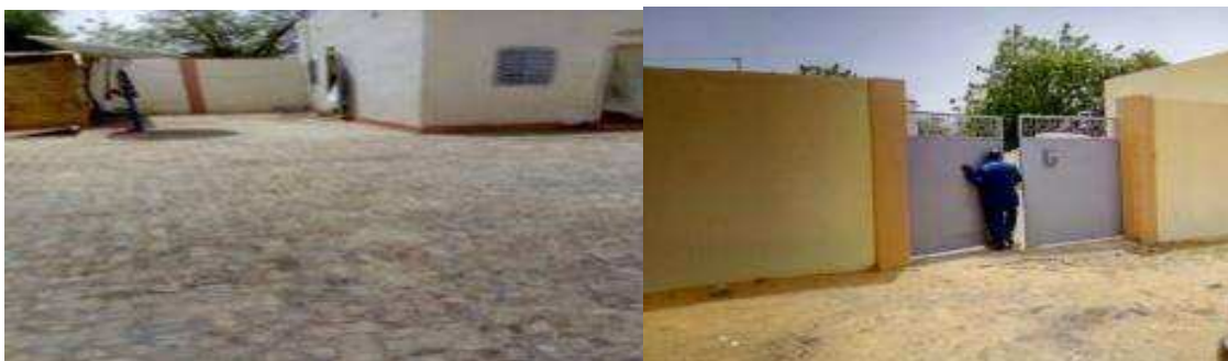
Pose pavage mur de clôture et entrée