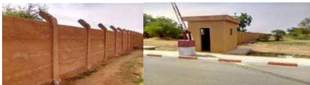
Raccordement des poteaux (mal fait)