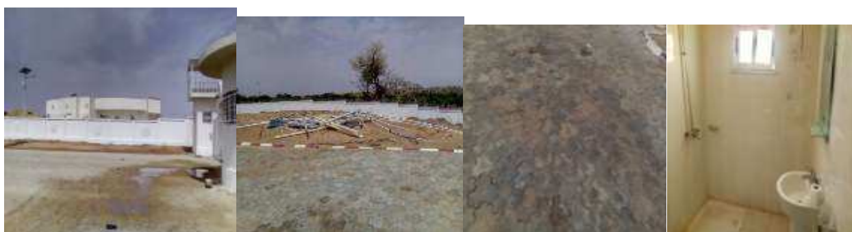
Mur de clôture Hangar tombé pose de pavée problèmes plomberies