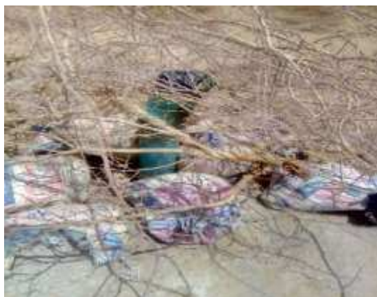
Tête du forage