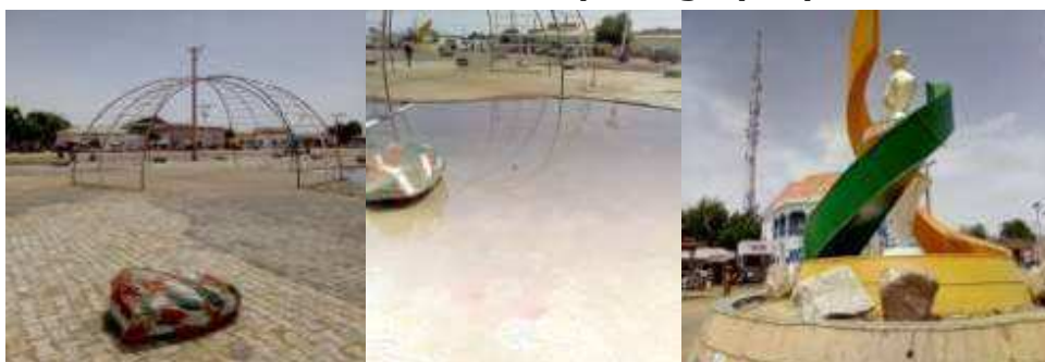
Vue du rond-point stagnation des eaux 2 ème rond-point