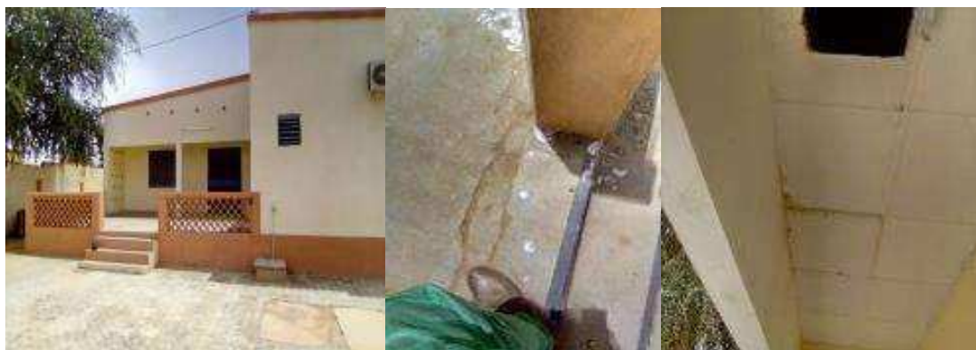
Vue de la villa fissures sur la forme d'aire problème d'étanchéité