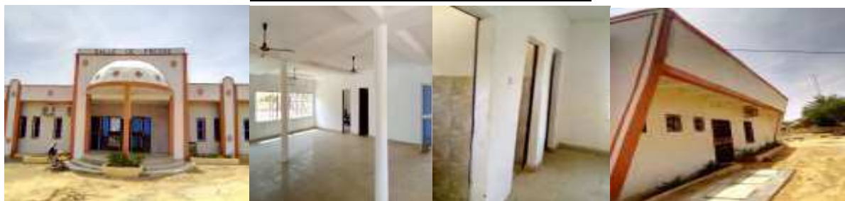
Salle de presse