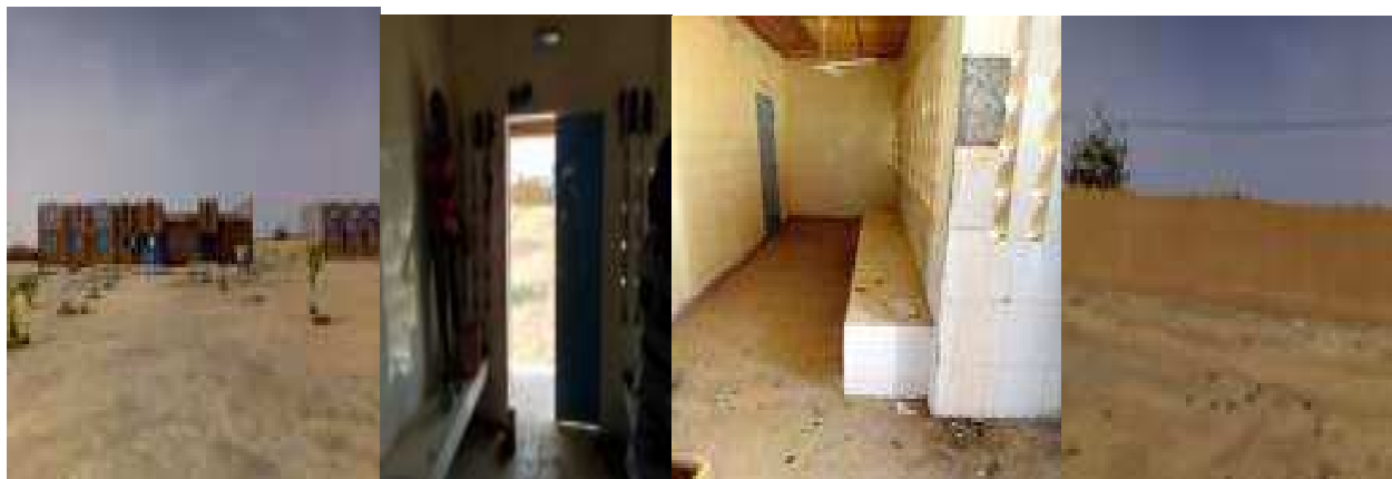
Vue CSI problème d'enduit (raccordement) poses carreaux Apparitions des fissures

✚ Marché n° : 01/2018/GC/MSP/SG/FC-PDS : Travaux de transformation des 10 cases de santé en centre de santé intégré de type 1 (CSI.1), 3ème phase : centré intégré CSI kokossey (DS Ouallam) :