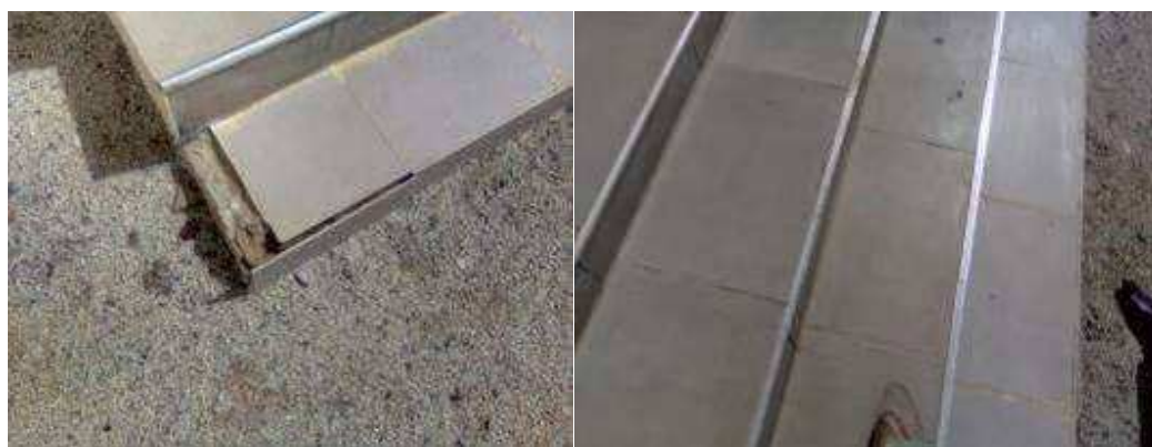
Problèmes de pose des carreaux