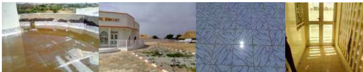
Toiture Salle banquet pose des carreaux enduits intérieur