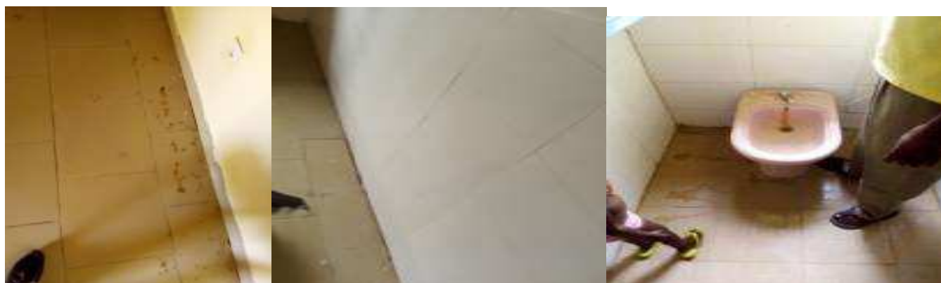
Problèmes de pose carreaux problèmes pose faïences problèmes de plomberies

✚ Marché n° : 015/2017/GC/MSP/SG/FC-PDS : Travaux de transformation des 10 cases de santé en centre de santé intégré de type 1 (CSI.1), 3 ème phase : centré intégré CSI korama lamso (DS Madaoua)