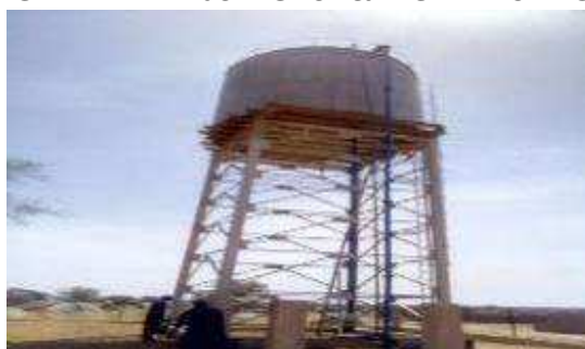
Château kokomani Haoussa