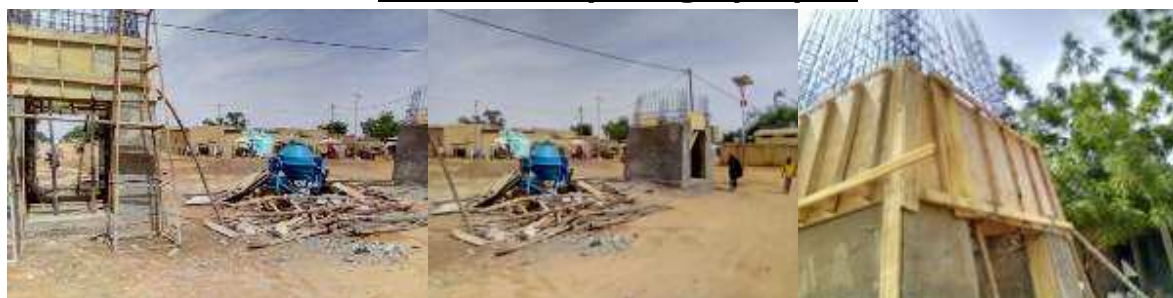
Vue générale photographique des travaux