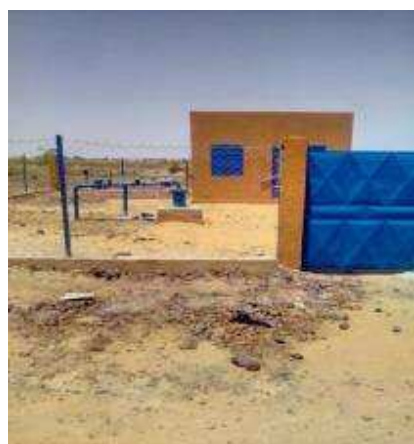
Zone du forage