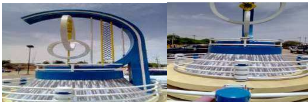
Vue générale sur le rond-point