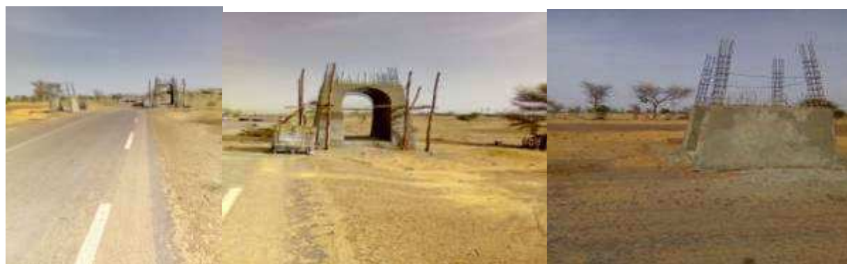
Vue générale sur les travaux de portique route Zinder Magaria