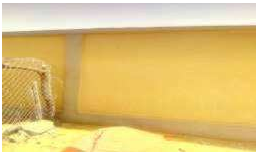
Fissures sur mur de clôture logement