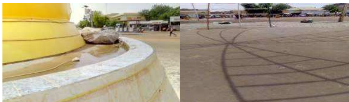
Stagnation des eaux