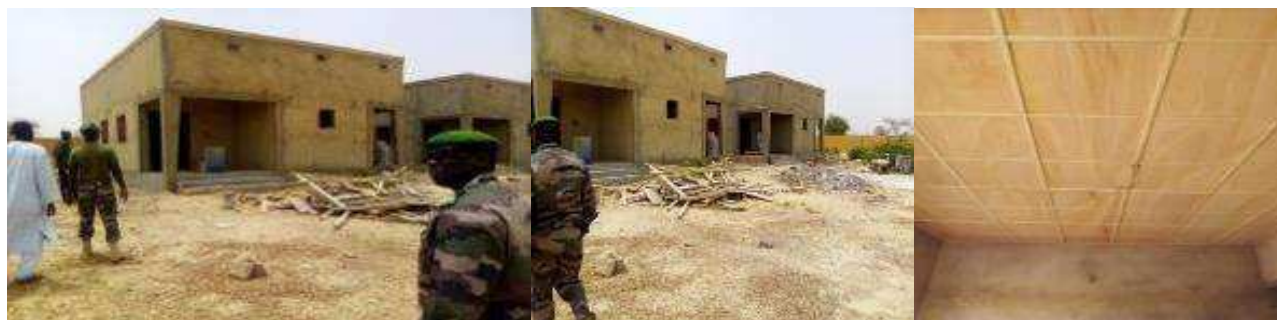
Logement officiers et sous-officiers (centre d'instruction zinder)