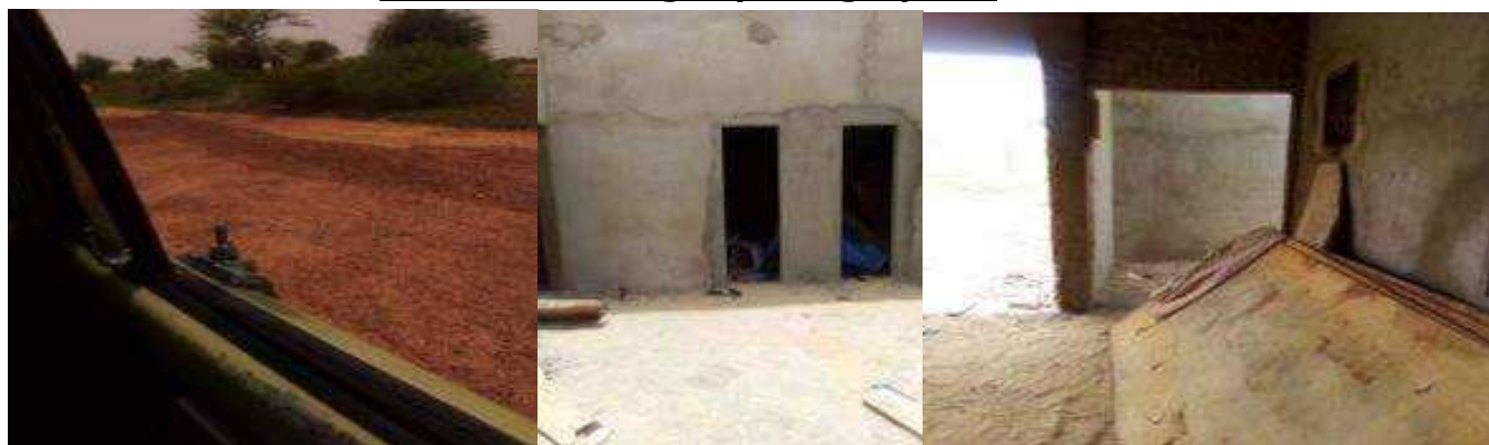
Travaux piste latéritique